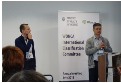
Twee Family-doctors presenteren eerste aanpak

De WONCA , de Wereld Organisatie van Family Doctors heeft een aantal werkgroepen waaronder de WICC. De WICC is de werkgroep voor het internationale classificatiesysteem voor ziekten in de Family Healthcare.